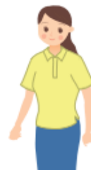
オーバーブラウス (女性のみ)